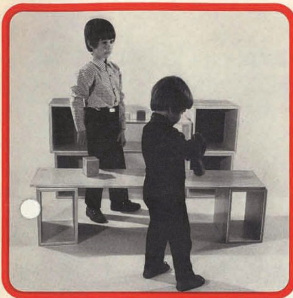
6004 Kubus (Größe 33 x 33 x 33 cm) Kubusboden in natur, blau, gelb, rot oder grün – bitte bei Bestellung angeben.

„Aus dem Spieltisch und dem Kasperletheater haben wir einen Kaufladen gemacht. In den Regalen haben wir jetzt viel Platz für Waren.“