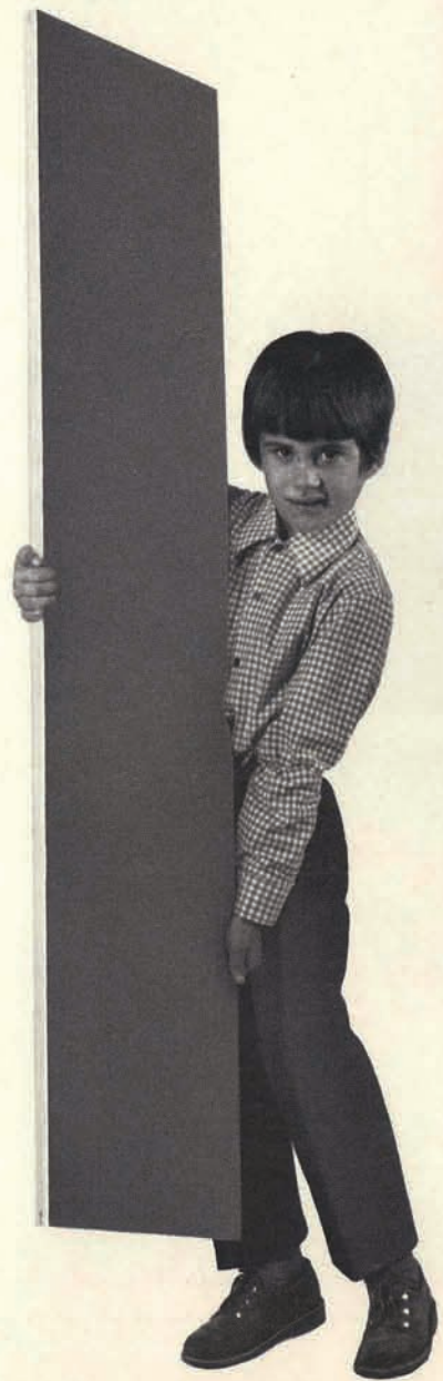
6003 Tafelbrett (Größe 132 x 33 cm)

„Unseren Tisch zum Spielen haben wir allein aufgestellt. Zwei Kuben und ein Brett, schon ist es fertig. Wenn wir malen oder schreiben wollen, drehen wir das Brett einfach um; denn auf der anderen Seite ist eine Tafel.“